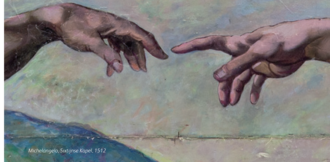
Michelangelo, Sixtijnse Kapel, 1512